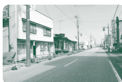
無人の浪江駅前商店街