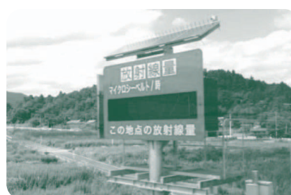
高速道路に設置された線量計