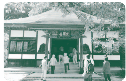
2015年9月5日に避難指示が解除された楢葉町の宝鏡寺