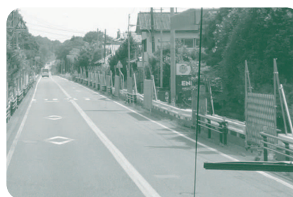
大熊町の帰還困難区域を通る国道6号線。民家の入口にはバリケードが