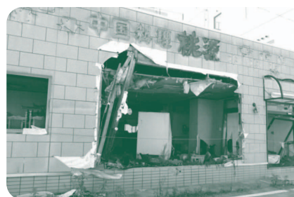
津波の被害を受けた富岡駅前