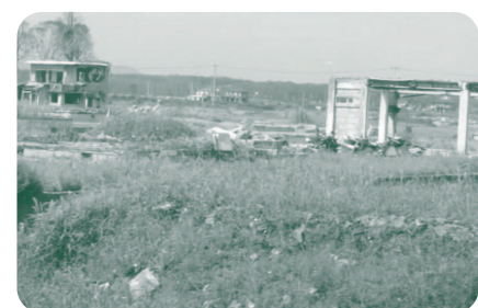
津波の被害を受けた浪江町の請戸地区の状態