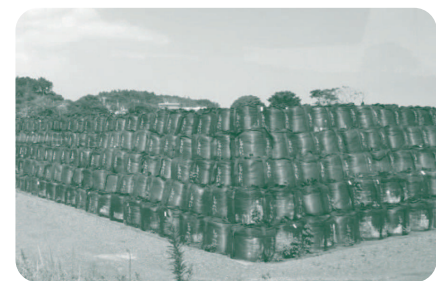
除染で出た放射性汚染物の仮置き場