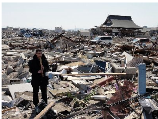
遺体が見つかった場所にゆりを供え、尺八の演奏