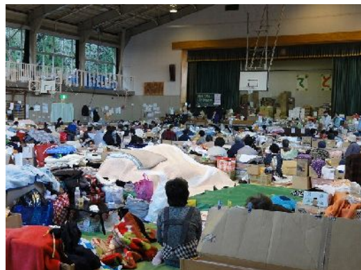
名取市館腰小学校の避難所