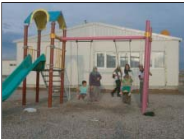
子供の遊び場もある（トルコ）