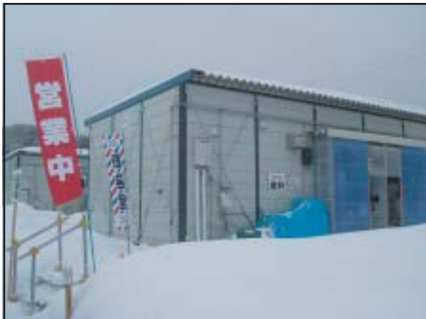
理容室も開業（中越・長岡）