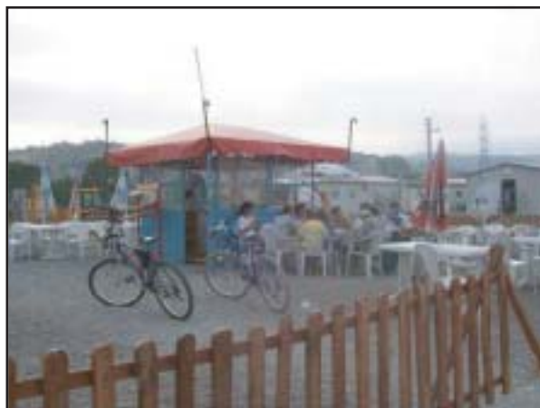
仮設村のカフェ（トルコ）