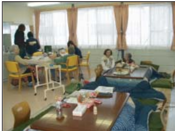
高齢者へのサービスをするケアセンター（中越・長岡）